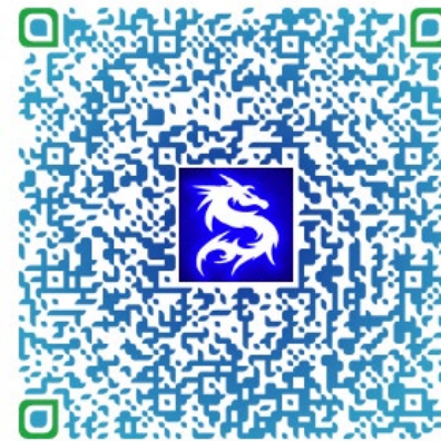
Carte de visite électronique