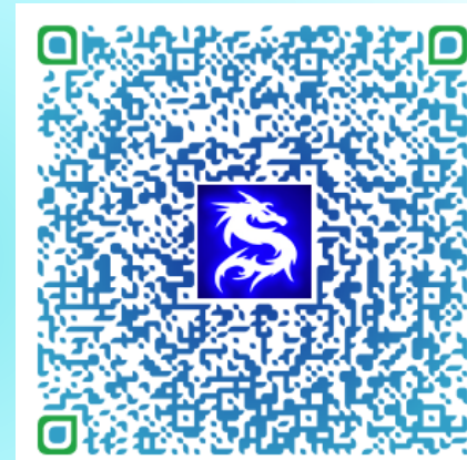
Carte de visite électronique