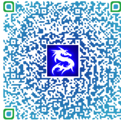
Carte de visite électronique