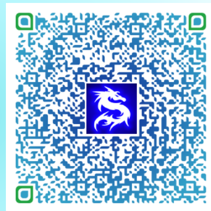
Carte de visite électronique