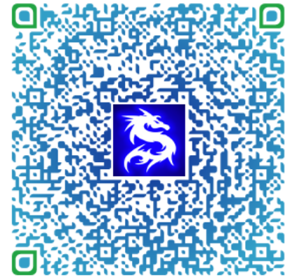
Carte de visite électronique