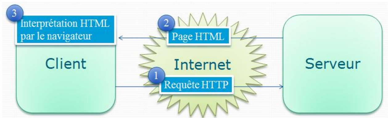
Figure 1 – Navigation Web

Voici une schématisation de ce qui se produit lors d'une navigation sur le Web :